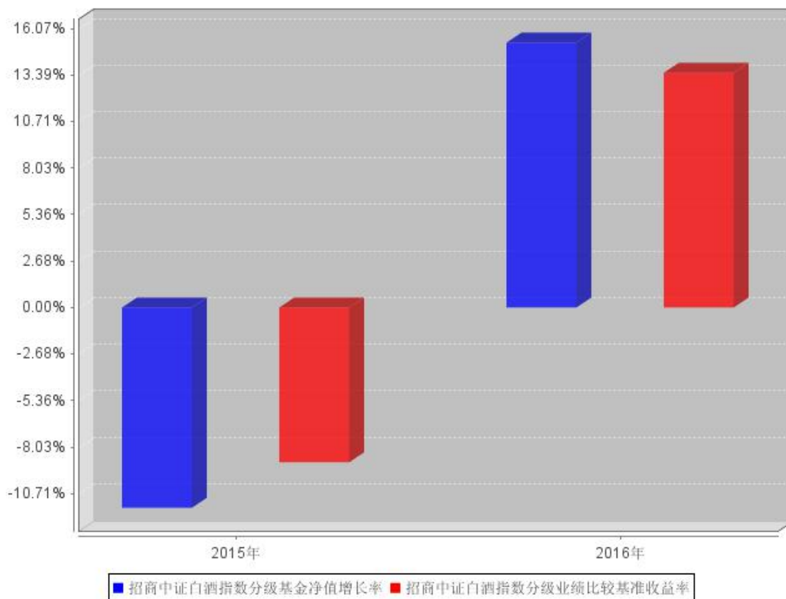
招商中证白酒指数分级自基金合同生效以来基金每年净值增长率及其与同期业绩比较基准收益率的对比图

注：本基金合同于 2015 年 5 月 27 日生效，截至 2015 年 12 月 31 日成立未满 1 年，故成立当年的净值增长率按当年实际存续期计算。