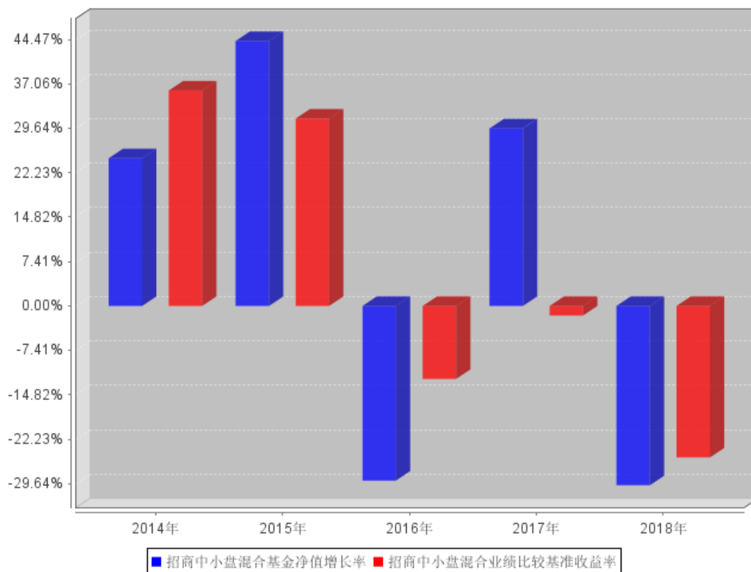
招商中小盘混合过去五年基金每年净值增长率及其与同期业绩比较基准收益率的对比图