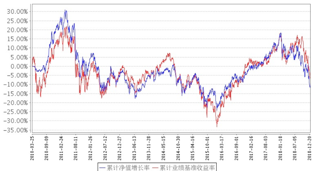
招商全球资源股票(QDII)累计净值增长率与同期业绩比较基准收益率的历史走势对比图