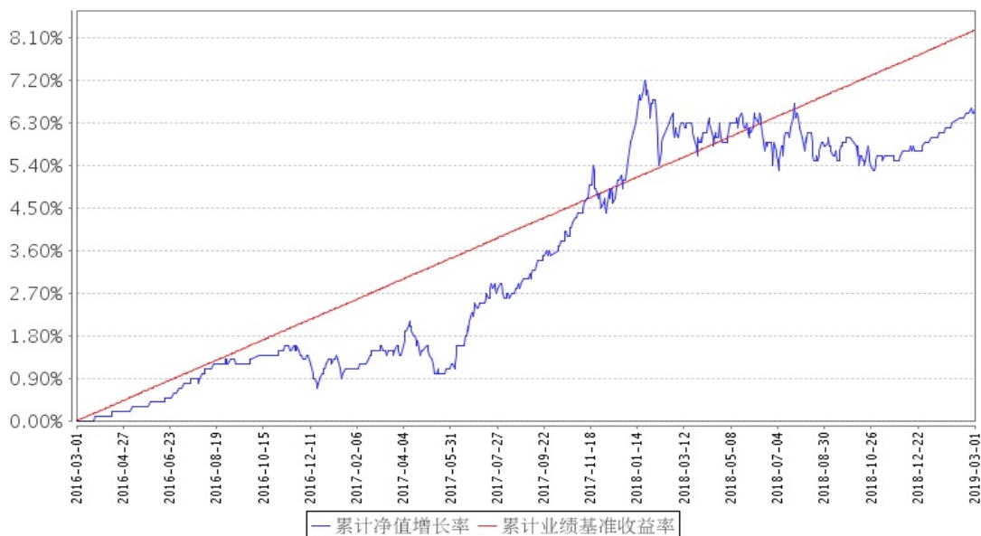
招商安元混合A累计净值增长率与同期业绩比较基准收益率的历史走势对比图

注：根据《招商安元保本混合型证券投资基金基金合同》的有关规定，2019年3月1日为招商安元保本混合型证券投资基金的第一个保本周期到期日，自2019年3月2日招商安元保本混合型证券投资基金转型为招商安元灵活配置混合型证券投资基金，因此上图本报告期间的结束日为2019年3月1日。