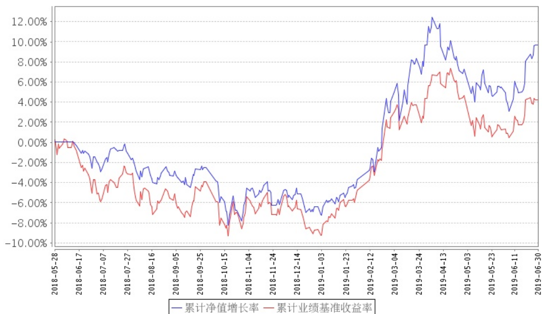
招商安博混合A累计净值增长率与同期业绩比较基准收益率的历史走势对比图