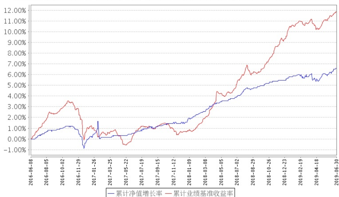
招商招恒纯债A累计净值增长率与同期业绩比较基准收益率的历史走势对比图