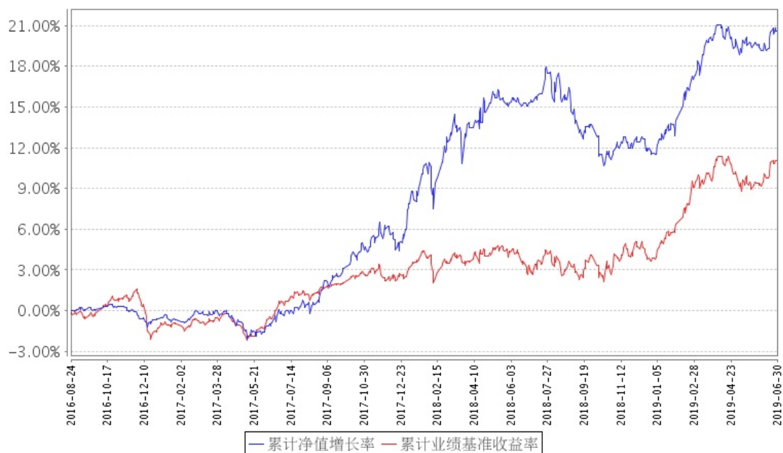
招商瑞庆混合A累计净值增长率与同期业绩比较基准收益率的历史走势对比图