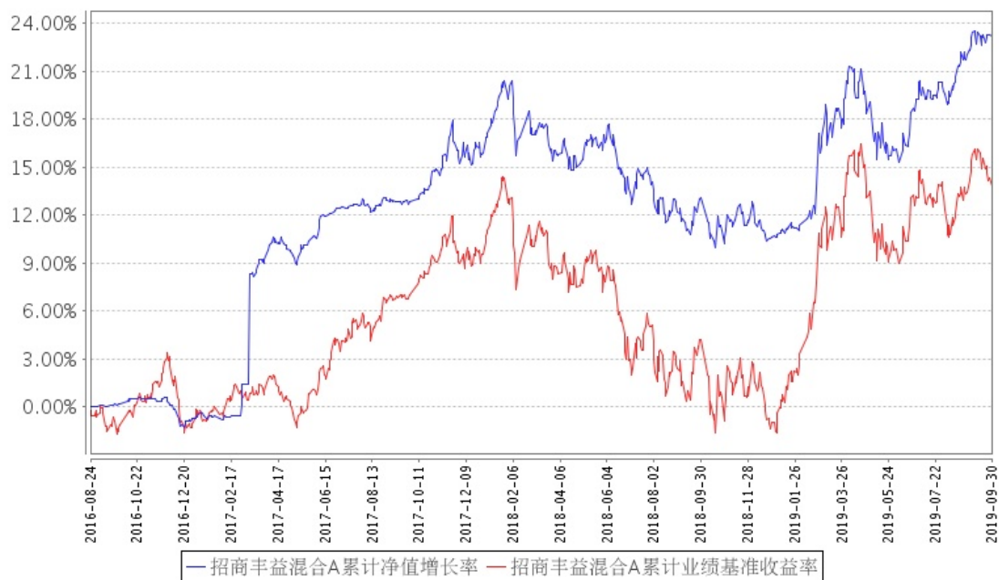
招商丰益混合A累计净值增长率与同期业绩比较基准收益率的历史走势对比图