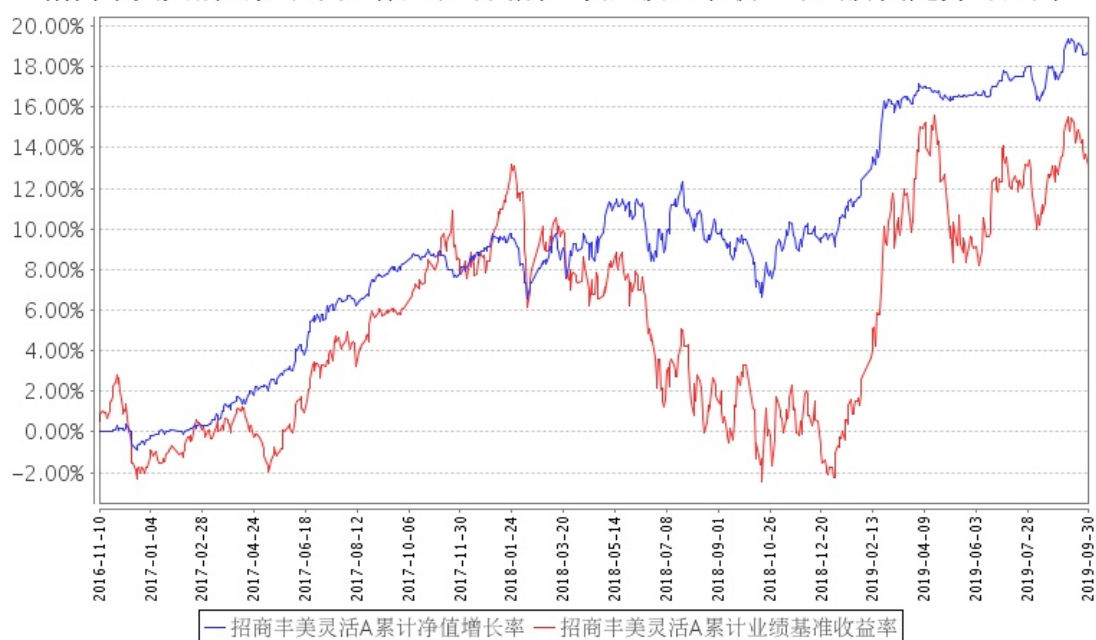
招商丰美灵活A累计净值增长率与同期业绩比较基准收益率的历史走势对比图