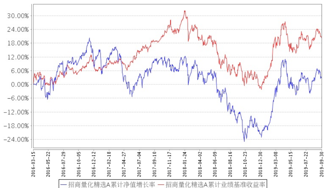
招商量化精选A累计净值增长率与同期业绩比较基准收益率的历史走势对比图