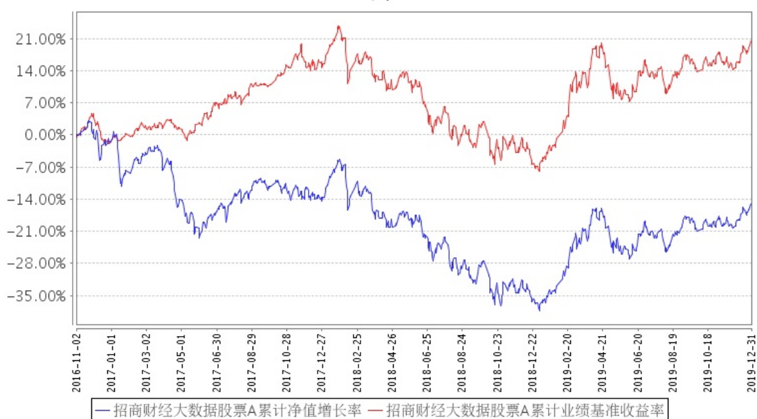
招商财经大数据股票A累计净值增长率与同期业绩比较基准收益率的历史走势对比图