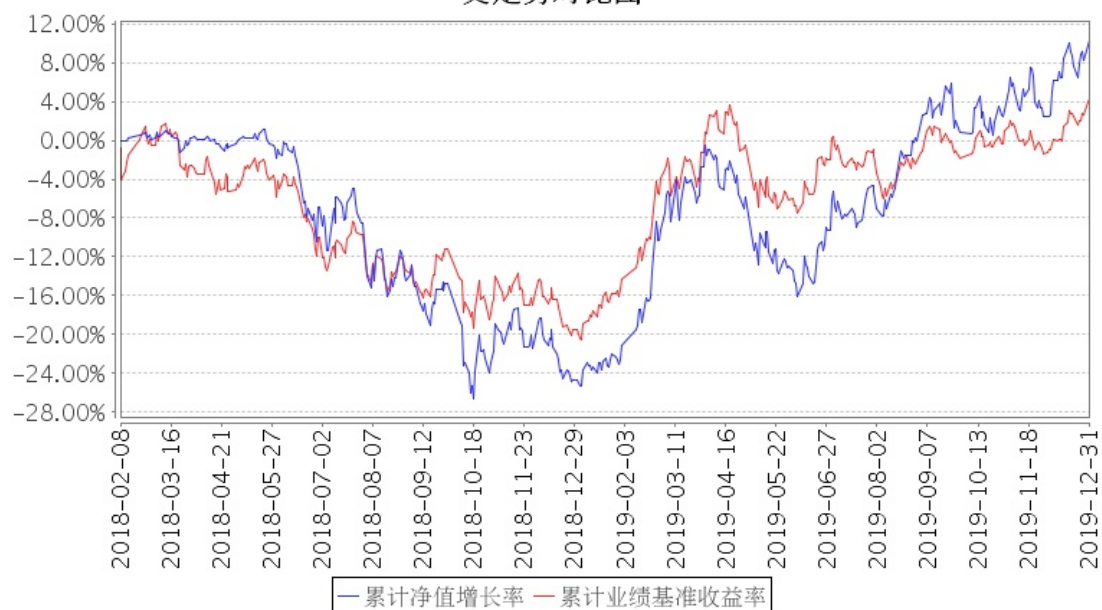
招商中国机遇股票型证券投资基金累计净值增长率与同期业绩比较基准收益率的历史走势对比图