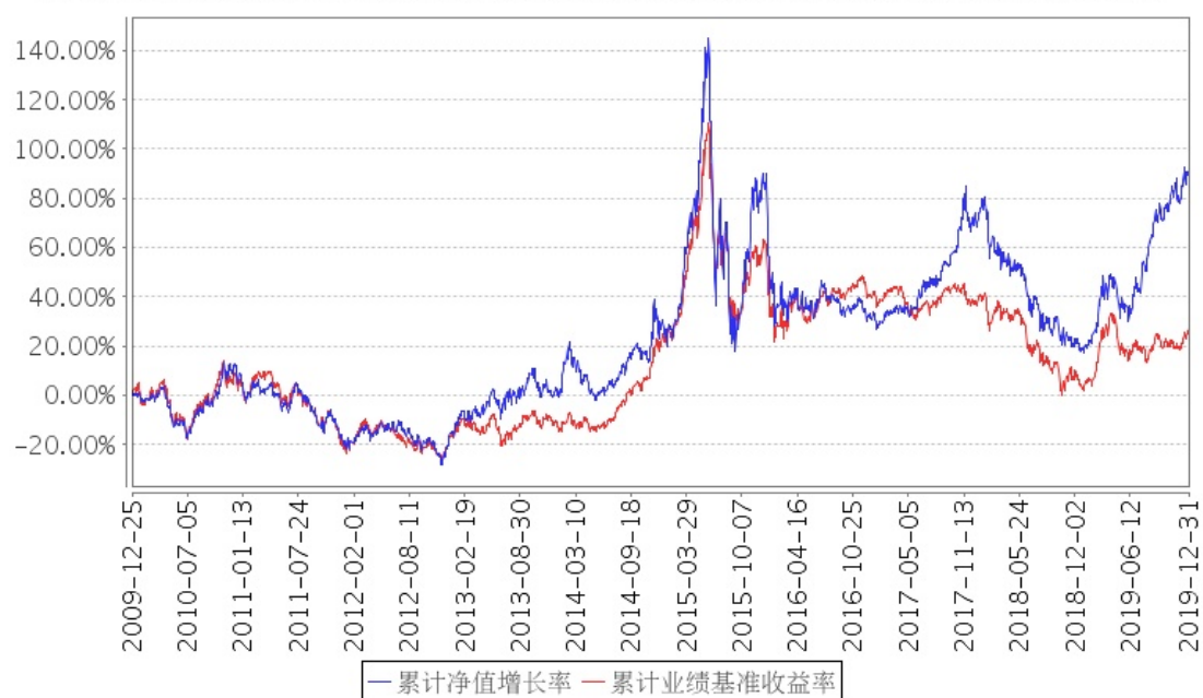
招商中小盘混合累计净值增长率与同期业绩比较基准收益率的历史走势对比图