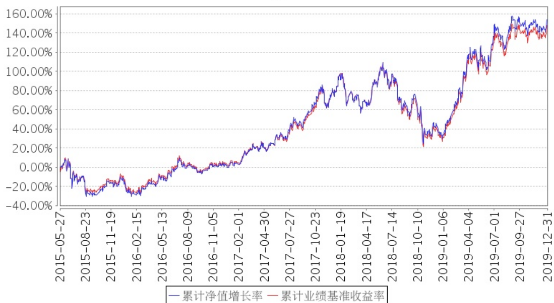
招商中证白酒指数分级累计净值增长率与同期业绩比较基准收益率的历史走势对比图