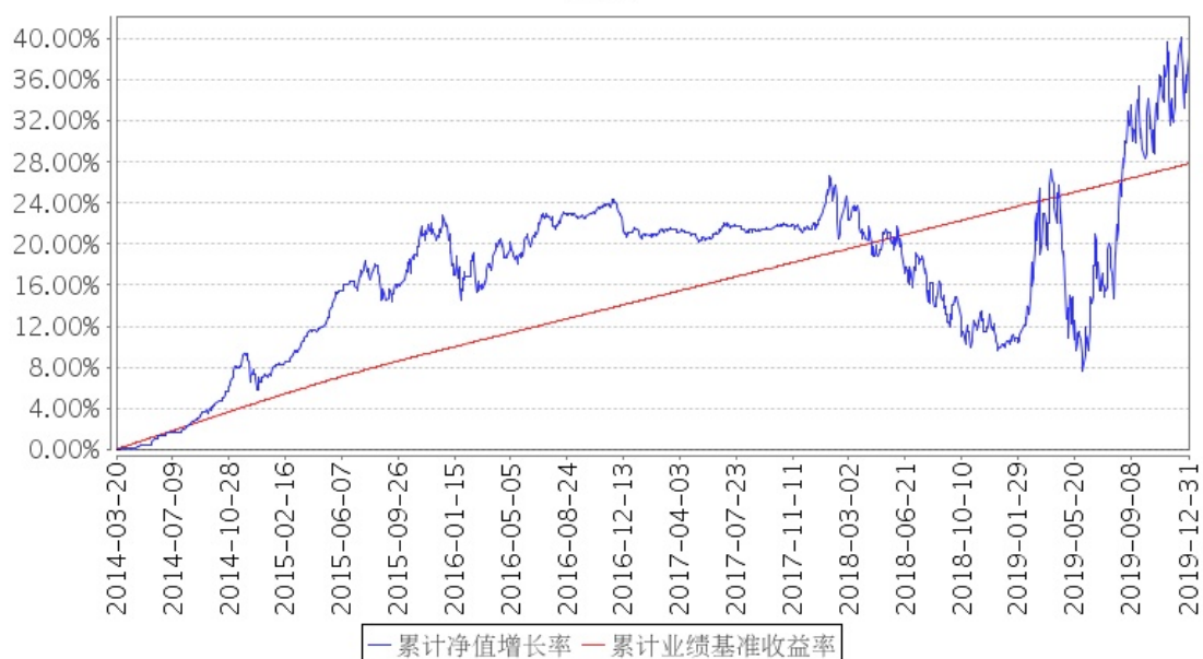
招商丰盛稳定增长混合A累计净值增长率与同期业绩比较基准收益率的历史走势对比图