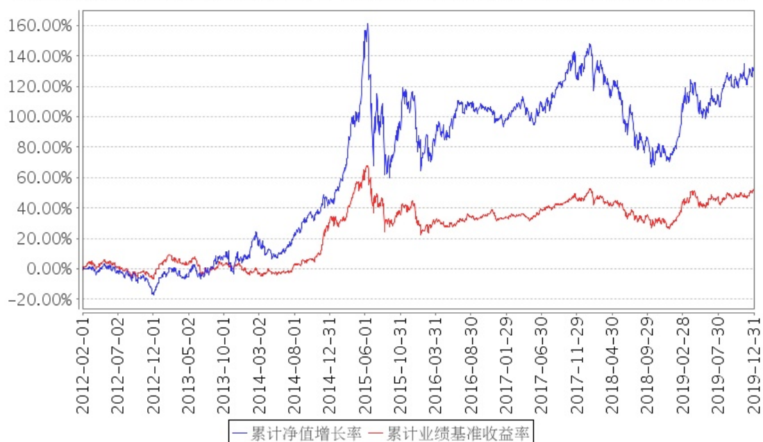
招商优势企业混合累计净值增长率与同期业绩比较基准收益率的历史走势对比图