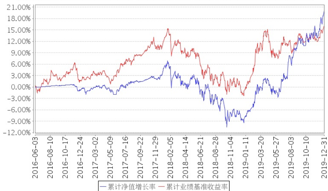
招商增荣混合累计净值增长率与同期业绩比较基准收益率的历史走势对比图