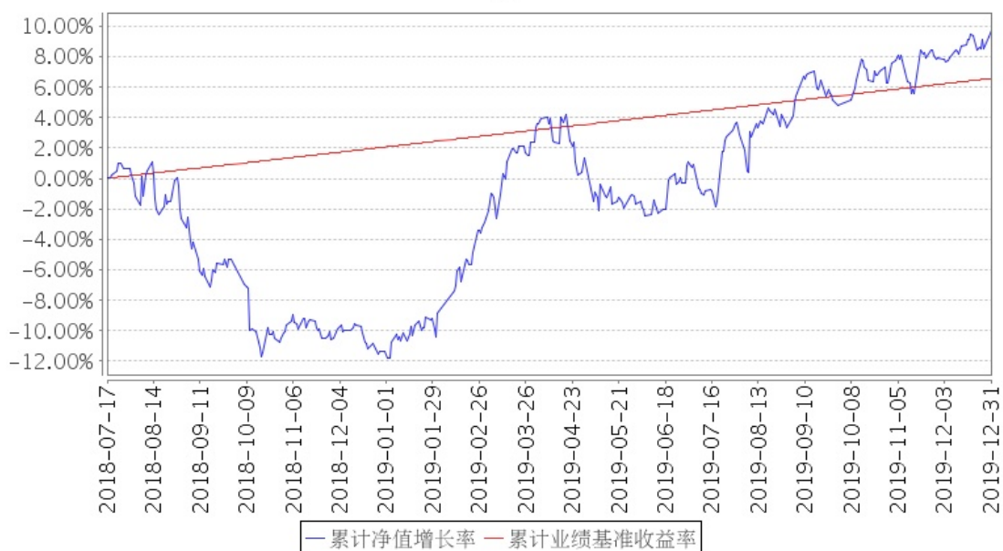
招商安益灵活配置混合累计净值增长率与同期业绩比较基准收益率的历史走势对比图

注：本基金转型日期为2018年7月17日，自基金成立日起6个月内为建仓期，建仓期结束时各项资产配置比例符合合同约定。