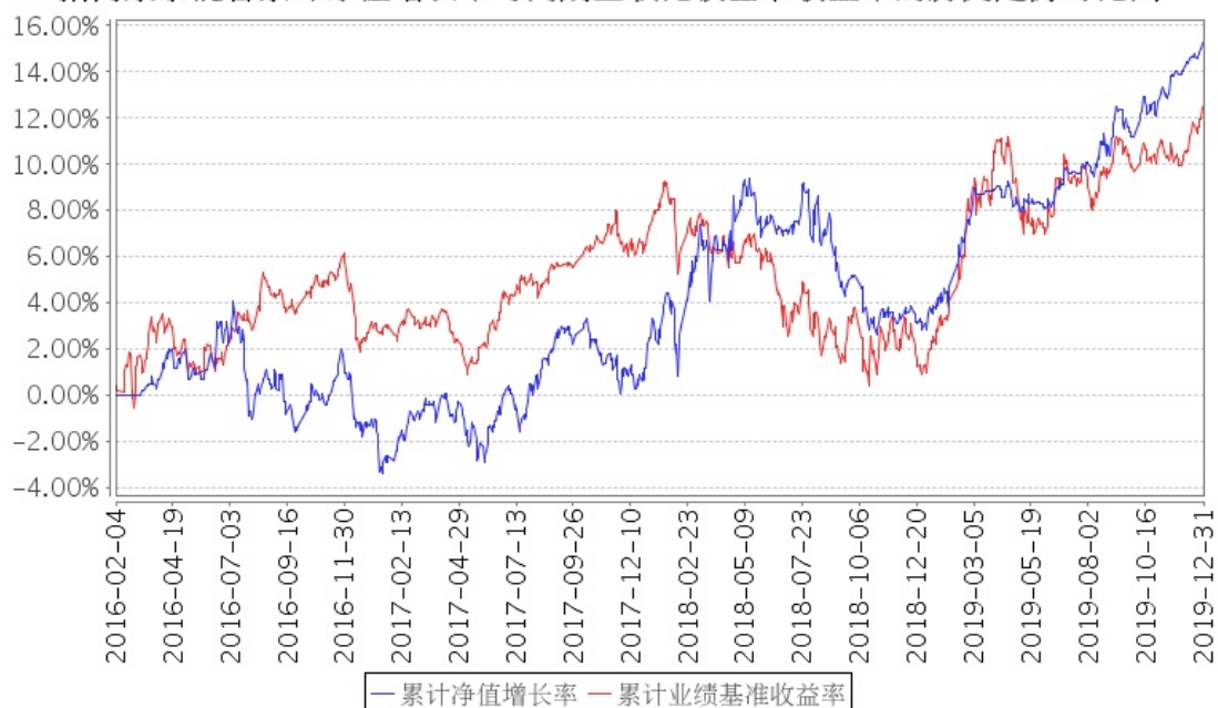
招商康泰混合累计净值增长率与同期业绩比较基准收益率的历史走势对比图