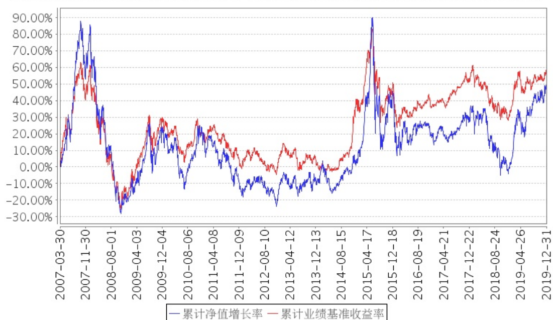
招商核心价值混合累计净值增长率与同期业绩比较基准收益率的历史走势对比图