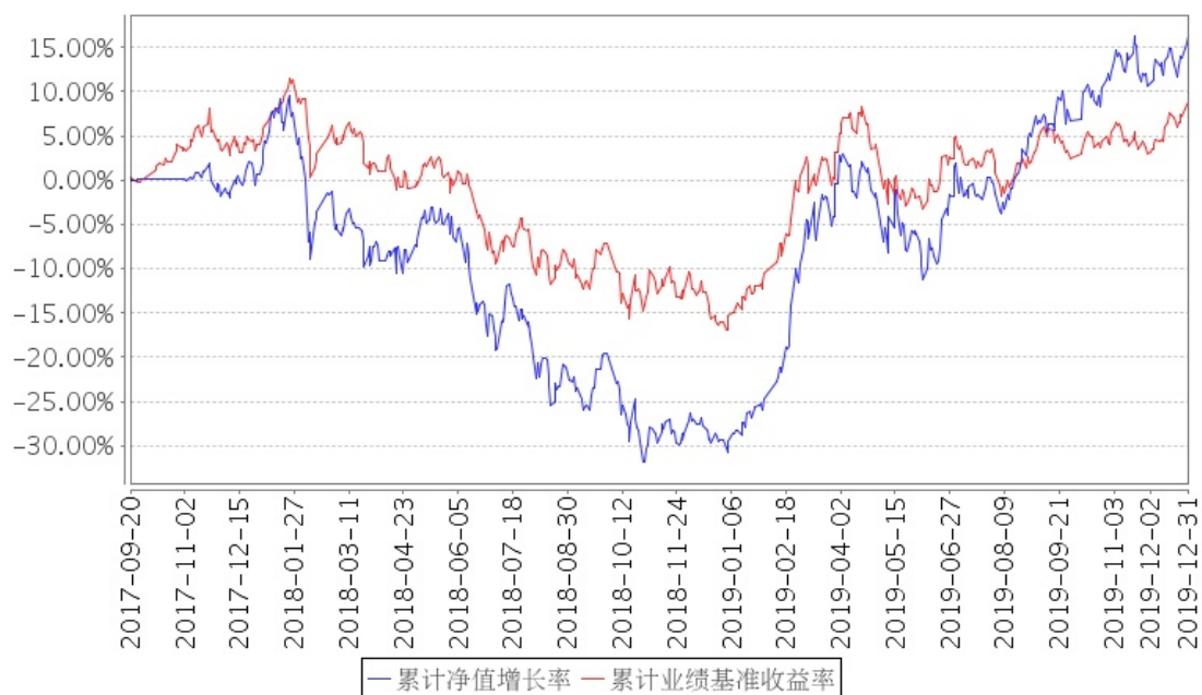
招商稳健优选股票累计净值增长率与同期业绩比较基准收益率的历史走势对比图