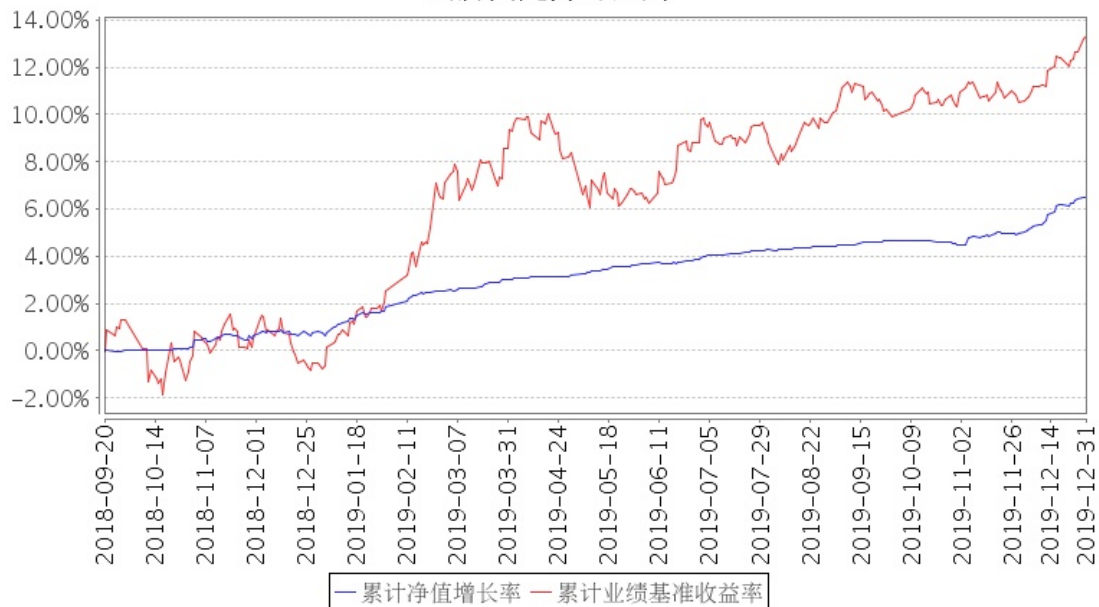
招商稳祺定期开放混合型证券投资基金累计净值增长率与同期业绩比较基准收益率的历史走势对比图