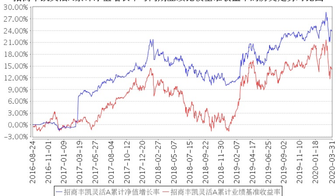
招商丰凯灵活A累计净值增长率与同期业绩比较基准收益率的历史走势对比图