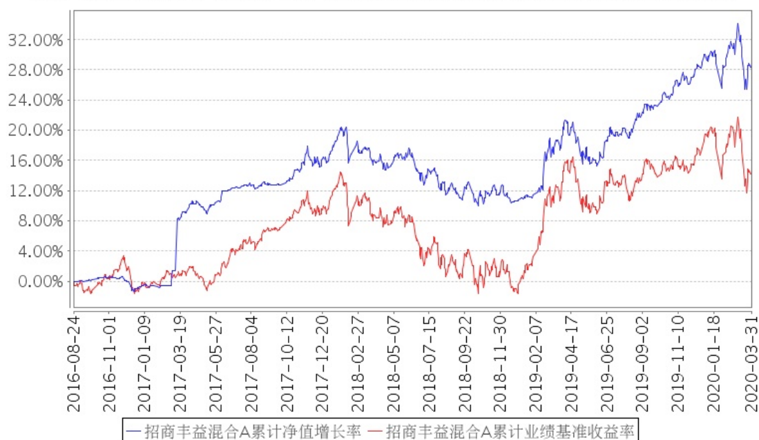
招商丰益混合A累计净值增长率与同期业绩比较基准收益率的历史走势对比图