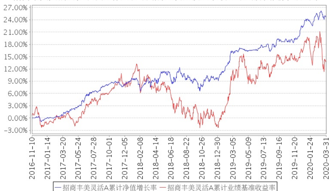
招商丰美灵活A累计净值增长率与同期业绩比较基准收益率的历史走势对比图