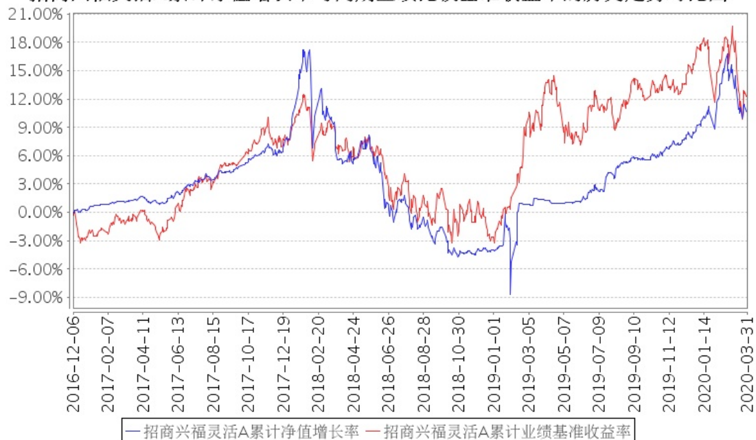
招商兴福灵活A累计净值增长率与同期业绩比较基准收益率的历史走势对比图