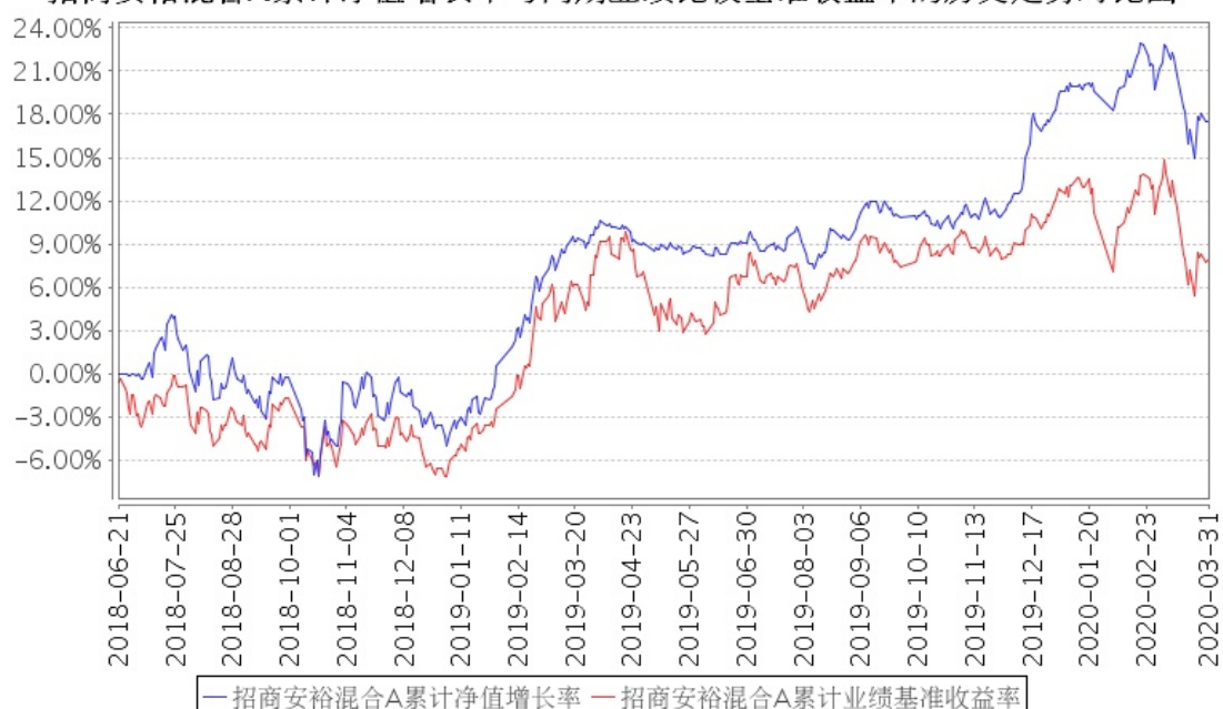
招商安裕混合A累计净值增长率与同期业绩比较基准收益率的历史走势对比图