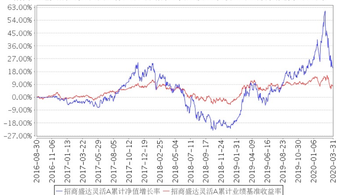
招商盛达灵活A累计净值增长率与同期业绩比较基准收益率的历史走势对比图