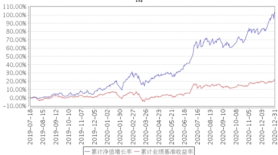
招商3年封闭瑞利混合累计净值增长率与同期业绩比较基准收益率的历史走势对比图