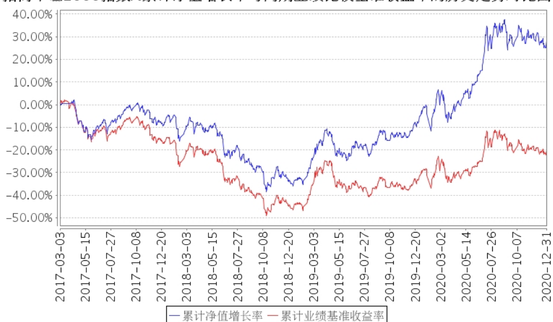
招商中证1000指数A累计净值增长率与同期业绩比较基准收益率的历史走势对比图