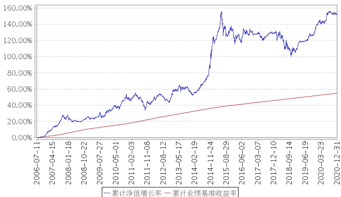
招商安本增利债券累计净值增长率与同期业绩比较基准收益率的历史走势对比图