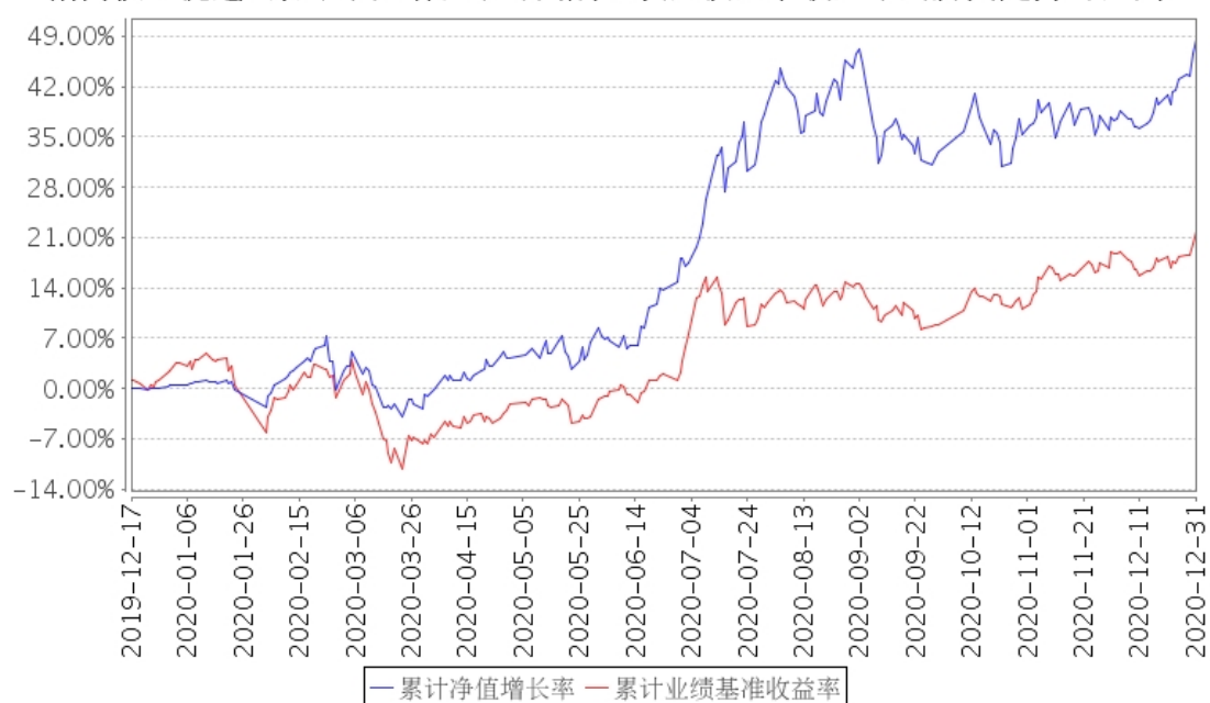
招商核心优选A累计净值增长率与同期业绩比较基准收益率的历史走势对比图