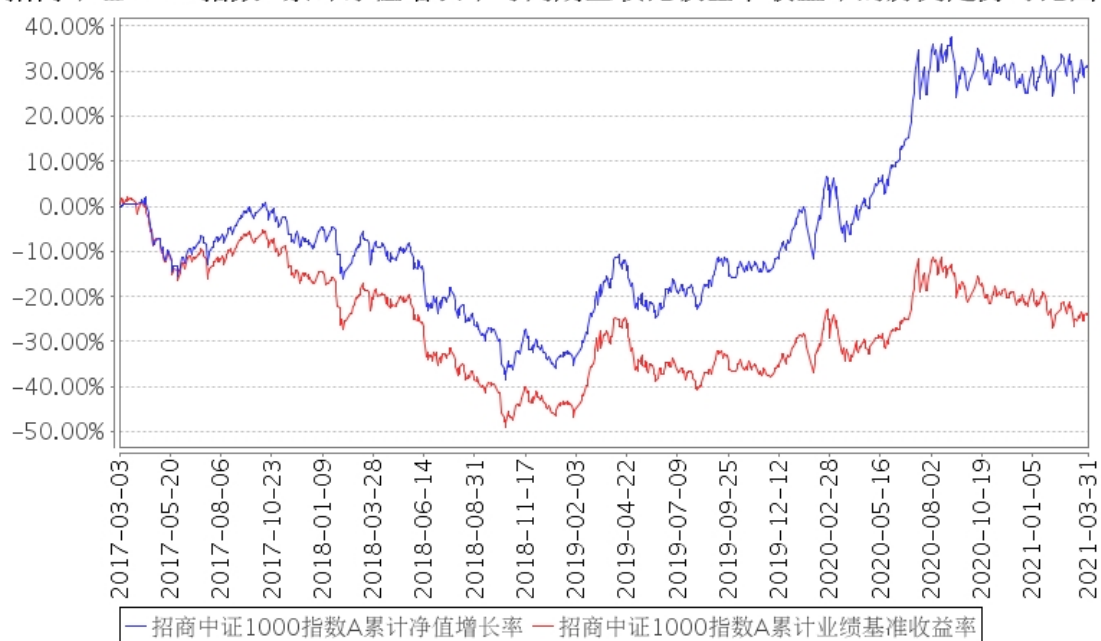
招商中证1000指数A累计净值增长率与同期业绩比较基准收益率的历史走势对比图