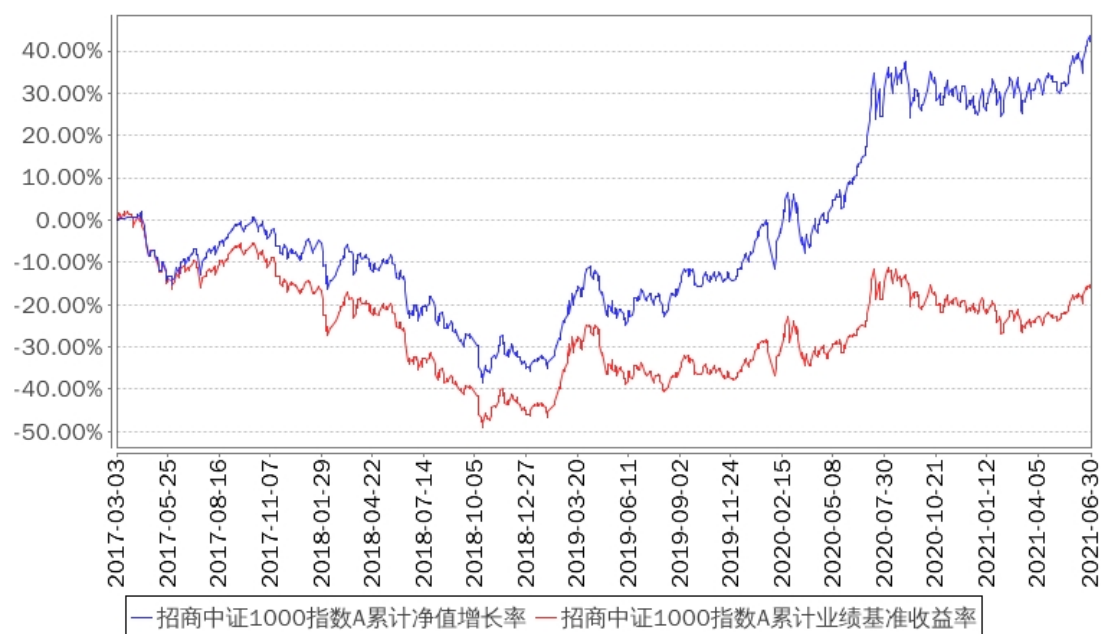
招商中证1000指数A累计净值增长率与同期业绩比较基准收益率的历史走势对比图