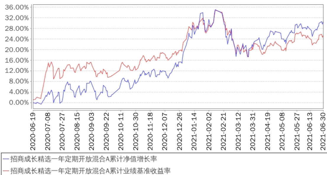
招商成长精选一年定期开放混合A累计净值增长率与同期业绩比较基准收益率的历史走势对比图