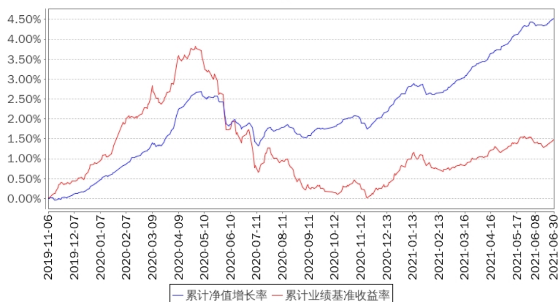
招商添韵3个月定开债A累计净值增长率与同期业绩比较基准收益率的历史走势对比图