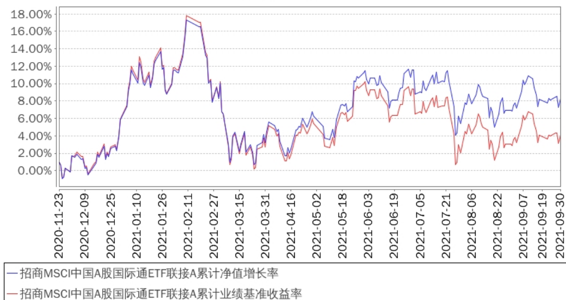
招商MSCI中国A股国际通ETF联接A累计净值增长率与同期业绩比较基准收益率的历史走势对比图