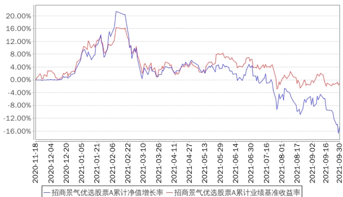
招商景气优选股票A累计净值增长率与同期业绩比较基准收益率的历史走势对比图