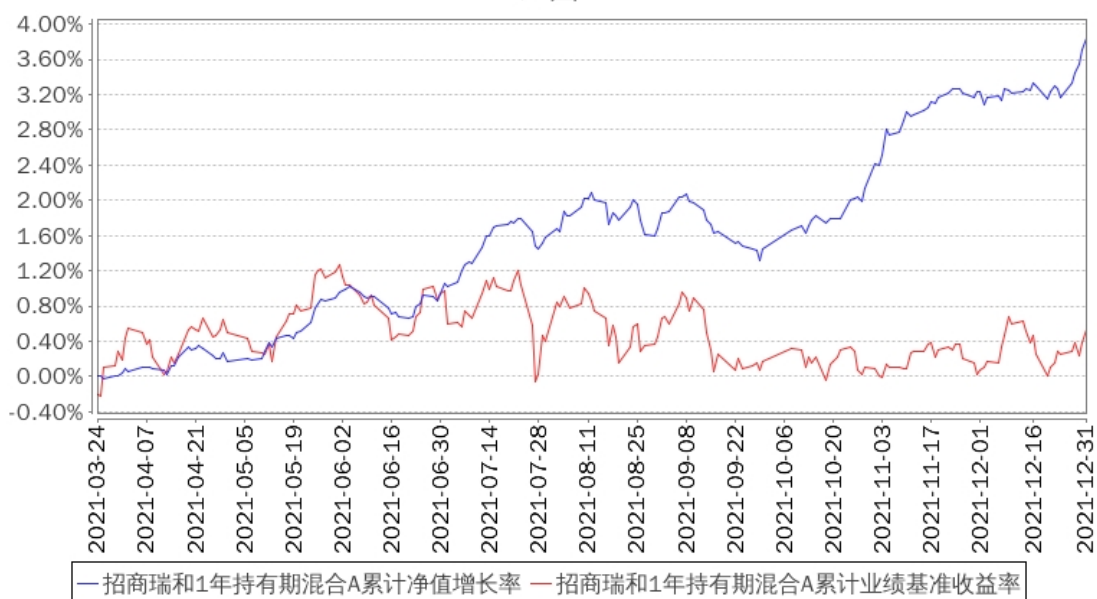
招商瑞和1年持有期混合A累计净值增长率与同期业绩比较基准收益率的历史走势对比图