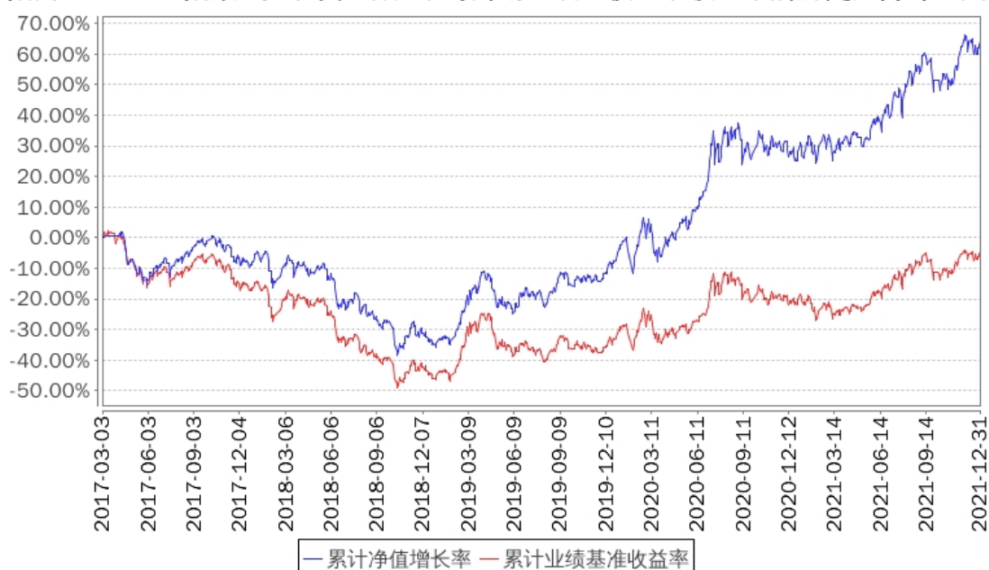
招商中证1000指数A累计净值增长率与同期业绩比较基准收益率的历史走势对比图