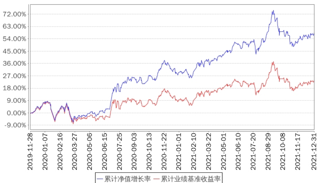
招商中证红利ETF累计净值增长率与同期业绩比较基准收益率的历史走势对比图