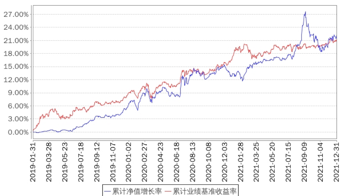
招商安庆债券累计净值增长率与同期业绩比较基准收益率的历史走势对比图