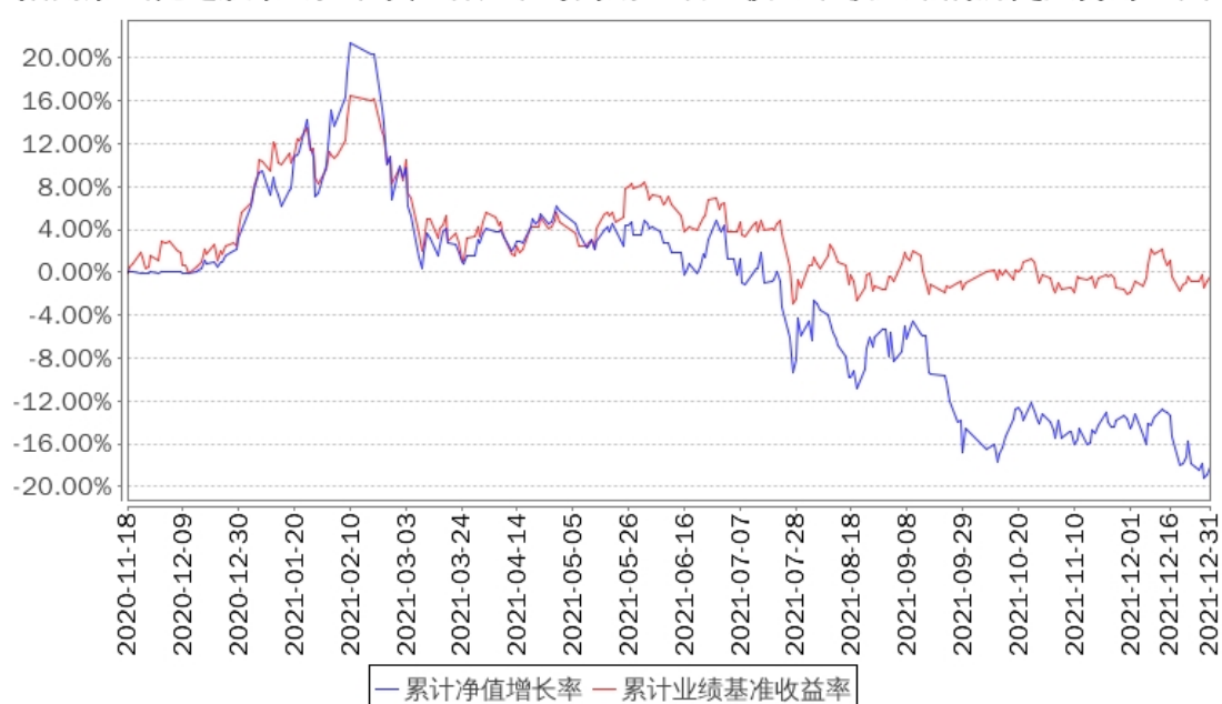
招商景气优选股票A累计净值增长率与同期业绩比较基准收益率的历史走势对比图