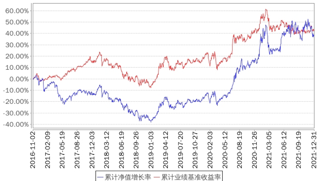
招商财经大数据股票A累计净值增长率与同期业绩比较基准收益率的历史走势对比图