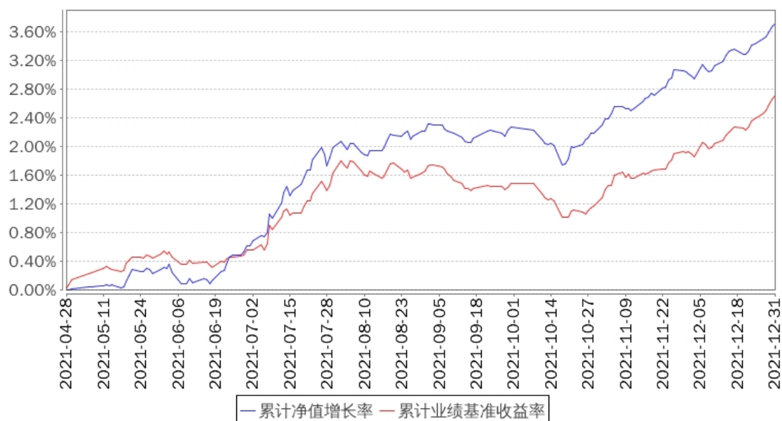
招商金融债3个月定开债累计净值增长率与同期业绩比较基准收益率的历史走势对比图