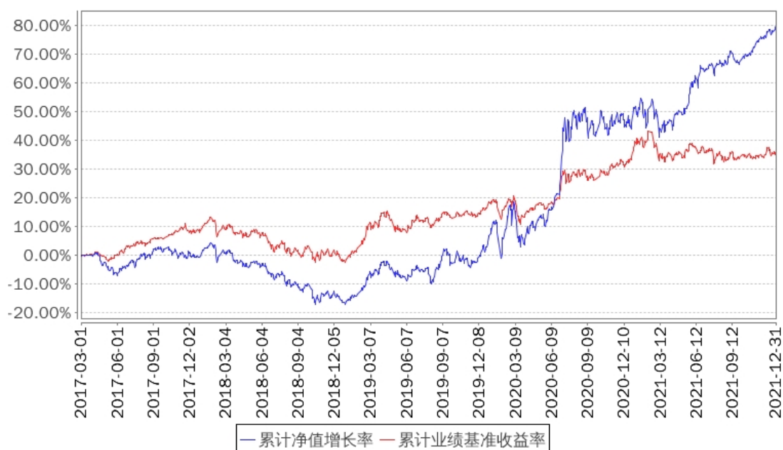
招商盛合灵活混合A累计净值增长率与同期业绩比较基准收益率的历史走势对比图