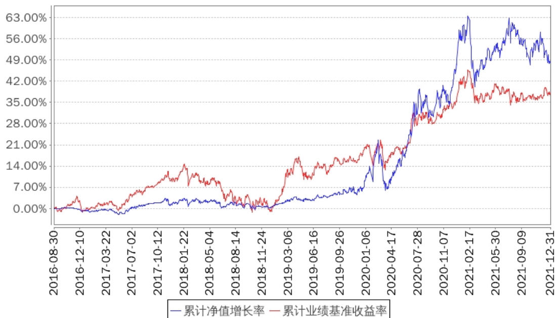
招商睿祥定开混合累计净值增长率与同期业绩比较基准收益率的历史走势对比图