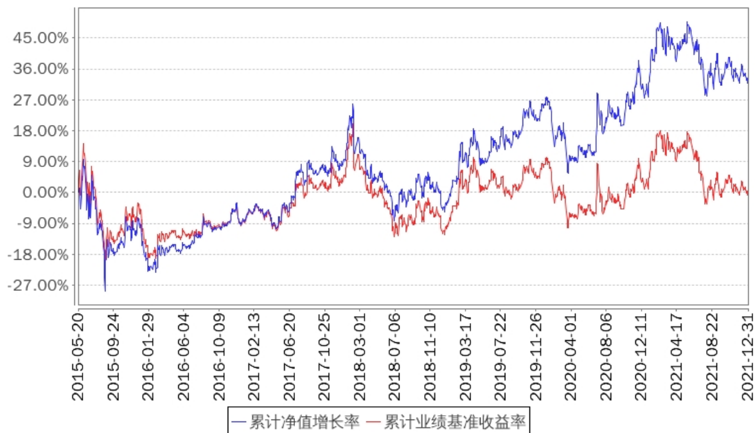
招商中证银行指数A累计净值增长率与同期业绩比较基准收益率的历史走势对比图