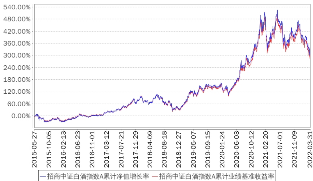
招商中证白酒指数A累计净值增长率与同期业绩比较基准收益率的历史走势对比图