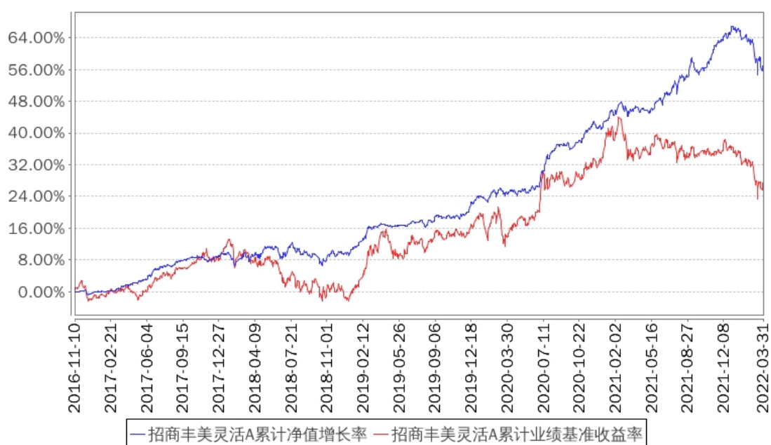
招商丰美灵活A累计净值增长率与同期业绩比较基准收益率的历史走势对比图